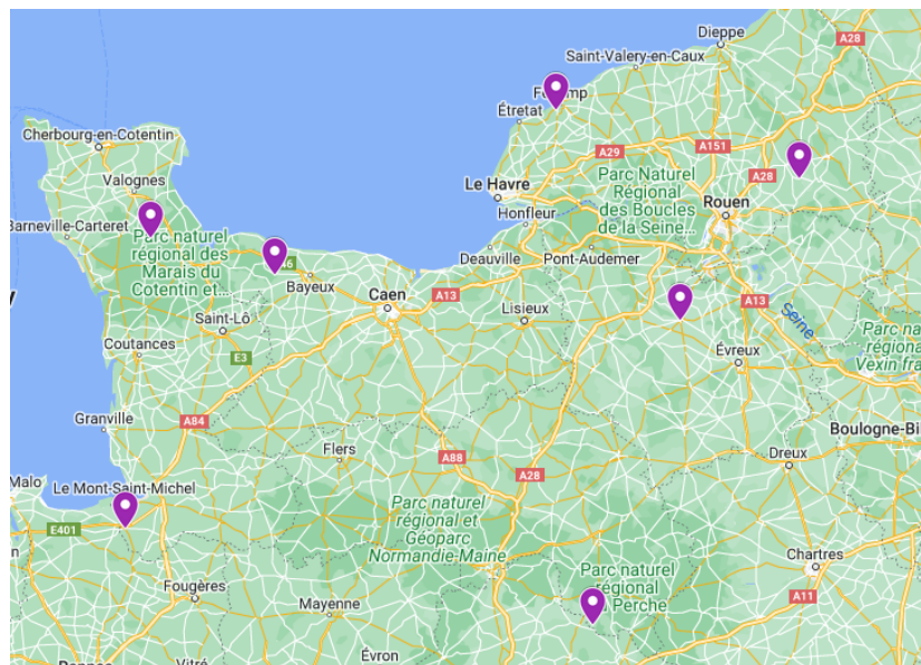
Figure 2 : Unités de méthanisation traitant du fumier équin

Le tonnage annuel de fumier équin traité est estimé à environ 6 500 tonnes par an .